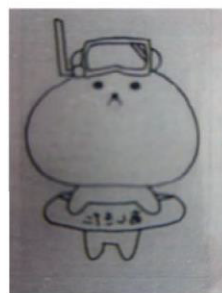
裏がえして色を塗る