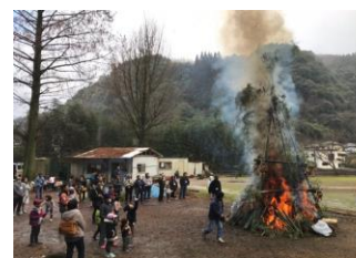
■水迫地区 新春どんどや

期日:10/26(土)~27(日) 対象:親子 15組 受付:10/6(日)~13(日)