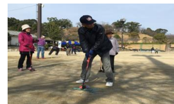
■学びの杜清流 ひなまつりグラウンドゴルフ大会