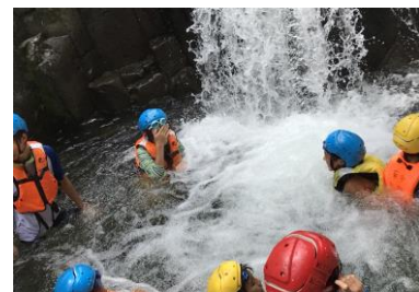
■ドキドキ！わくわく！ サマーキャンプ！！

期日:8/24(土)~25(日) 対象:小・中学生 30人 受付:8/4(日)~11(日)