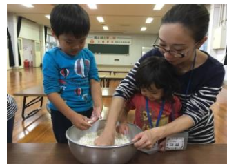
■ファミリーキャンプ！！