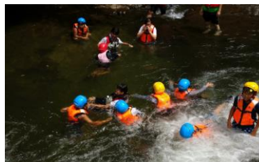
■夏だ！川だ！サンサンサマー

期日:7/21(日) 対象:小・中学生 50人 受付:6/30(日)~7/7(日)