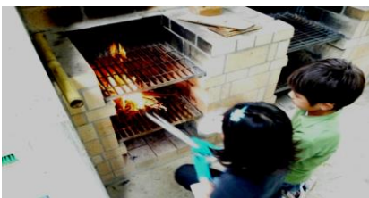
■菊池のサバイバルキャンプ！！

期日:9/14(土)~16(月) 対象:小・中学生 25人 ※小学生の学年は検討中 受付:8/25(日)~9/1(日)